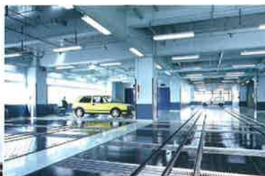
関東最大級の整備工場、亀戸工場。